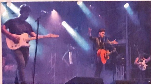
Das Quintett Antiheld aus Stuttgart überzeugte das Moosburger Publikum voll.