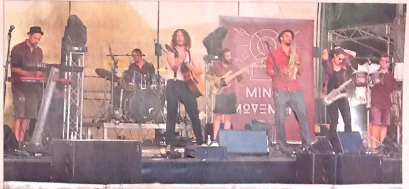
Tanzbare Gute-Laune-Musik mit der richtigen Prise Humor bieten Minor Movement.