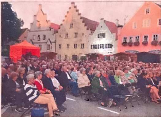
Das Konzert des Kammerorchesters vor historischer Kulisse fand am Freitagabend viele Zuhörer.

Momentaufnahmen vom Sommerfestival