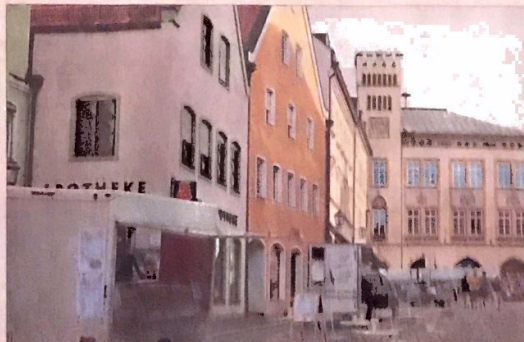
Allein schon die abwechslungsreiche Erlebnisgastronomie im kostenfreien Außenbereich hätte am Samstag sichtbar mehr Gäste verdient.