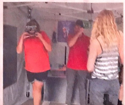
Am Rauschbrillen-Parcours waren die Wirkungen von zu viel Alkohol am eigenen Leib erfahrbar.