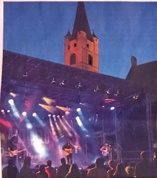
Stimmungsvolle Mischung: Antiheld in der Abenddämmerung vor dem Johannesturm.