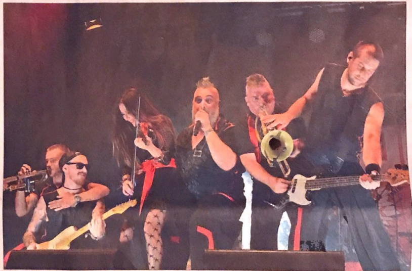
Russkaja steht für Friede, Liebe und „Russian Roll“ mit hohem Spaßfaktor.