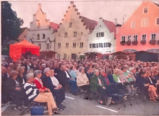
Das Konzert des Kammerorchesters vor historischer Kulisse fand am Freitagabend viele Zuhörer.

Momentaufnahmen vom Sommerfestival